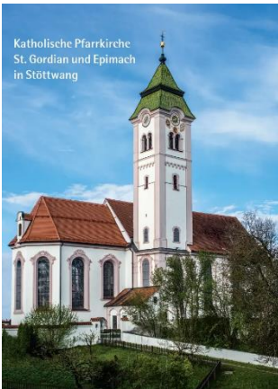
Katholische Pfarrkirche St. Gordian und Epimach in Stöttwang

Montag, 5.5.2025 und Dienstag 6.5.2025 in Stöttwang / Germaringen